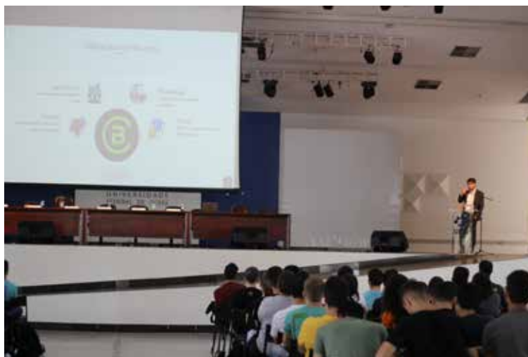
Apresentação do Amigos do Brasil Central no VI Congresso de Engenharia e Tecnologia - CET 2019