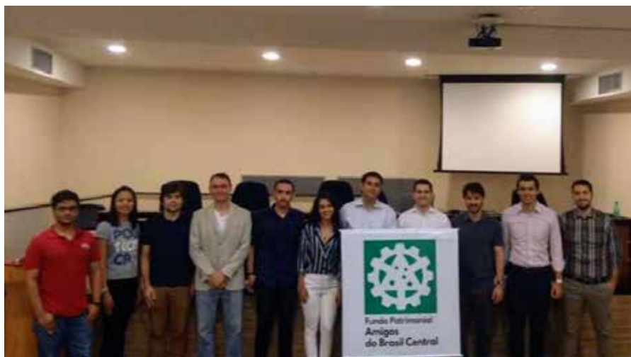
Cerimônia de inauguração do Amigos do Brasil Central