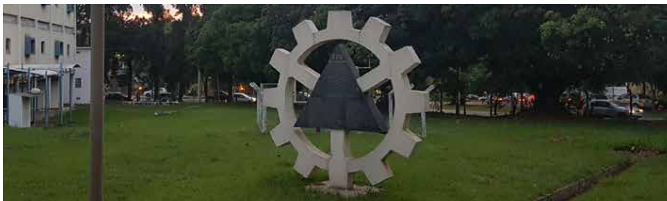
Monumento Símbolo das Engenharias - Quadra das Engenharias, UFG

Apoio à academia: Abriremos um edital para que professores, organizações estudantis e estudantes de engenharia da UFG possam submeter projetos que precisem de incentivo financeiro para sua conclusão. Os projetos selecionados serão contemplados com recursos do Fundo e serão divulgados em nossos veículos de comunicação. Além disso, cada projeto selecionado terá um espaço reservado no nosso relatório anual.